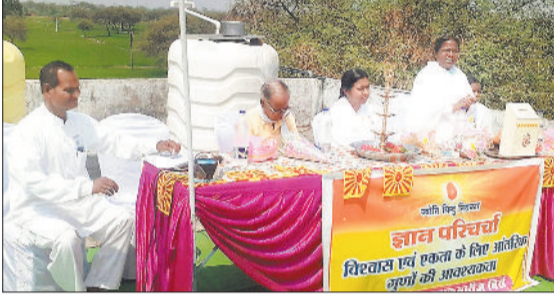
उपस्थित लोगों को जानकारी देती ब्रह्म कुमारी बहनें।

प्रजापिता ब्रह्मा कुमारी ईश्वरीय विश्व विद्यालय की स्थानीय सेवाकेंद्र में रविवार 5 अप्रैल को सुबह 11.30 से आयोजित विश्वास