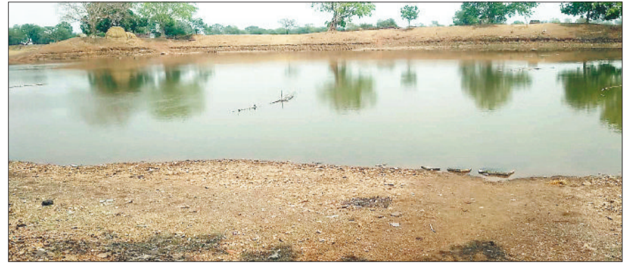
गोधना का सूखता नया तालाब।