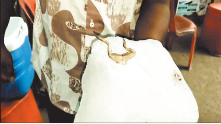
बर्फ में निकला मेंढक।

घंटाघर चौपाटी में एक सोडा-गन्ना जूस की दुकान में यह लापरवाही सामने आई। जानकारी के मुताबिक की शुरुवार शाम कुछ ग्राहक जूस पीने पहुंचे थे। जूस तैयार करने के बाद जब दुकानदार बर्फ तोड़ रहा था, तभी उसमें मरा हुआ मेंढक दिखाई दिया। यह देखकर ग्राहकों पर मौजूद लोग हैरान रह गए और देखते ही देखते वहां भीड़ जमा हो गई। घटना का वीडियो भी सामने आया है।