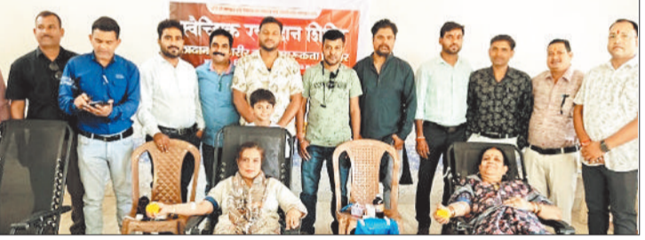
जरुरतमंदों को लिए शिविर में रक्तदान करते लोग।