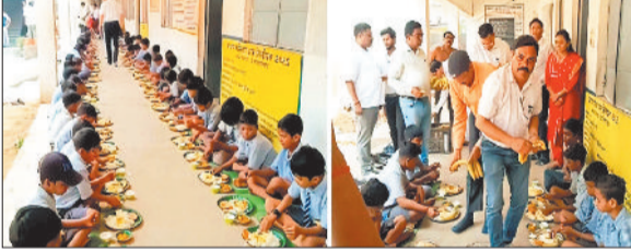
न्योता भोज करते बच्चे।

शासकीय बालक पूर्व माध्यमिक शाला शिवरीनारायण में 'न्योता भोज' कार्यक्रम का आयोजन उत्साहपूर्ण वातावरण में किया गया।